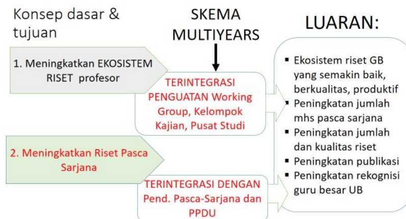
Gambar 2: Konsep umum hibah penguatan ekosistem riset Guru Besar UB

Ekosistem riset guru besar mengacu pada suatu kondisi bahwa guru besar tidak bekerja sendiri dalam kegiatan penelitian. Ekosistem riset guru besar adalah situasi di mana seorang guru besar memiliki dan mengembangkan tim riset yang melibatkan setidaknya dosen junior, mahasiswa sarjana dan/ pasca sarjana, dan mendapatkan dukungan dari stakeholder terkait dalam kegiatan riset dan kegiatan pengabdian yang dilakukan. Ekosistem riset dibangun atas dasar peta jalan penelitian yang akuntabel. Ekosistem riset memberi ruang bagi interaksi guru besar dan anggotanya lewat pembimbingan dan pengawasan kepada mahasiswa secara intensif melalui diskusi, seminar, research dan publication assistance , dan kegiatan sejenis lainnya.